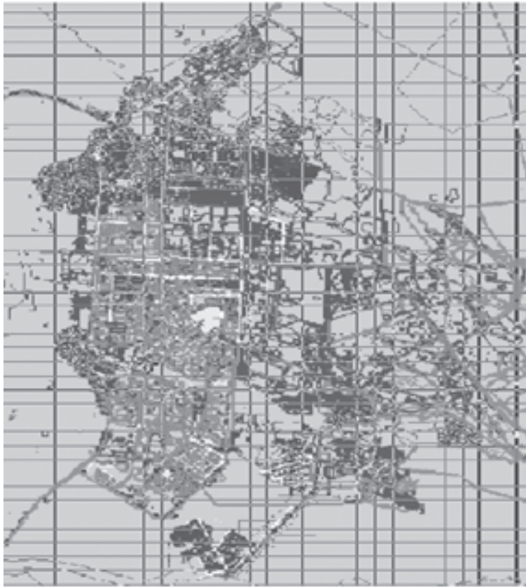
Рис. №2. Схема водоотведения.

СХЕМА водоснабжения и водоотведения города Альметьевска Альметьевского муниципального района Республики Татарстан на 2015-2030 годы.